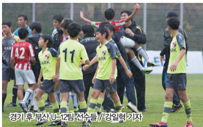
경기후 부산 U-12팀 선수들