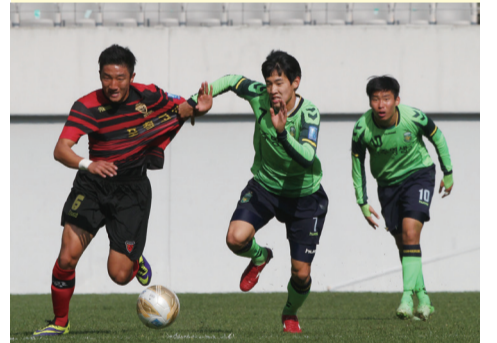
아무리 급해도 옷을 잡지는 말라고~ (포항 U-18팀 vs. 전북 U-18팀)