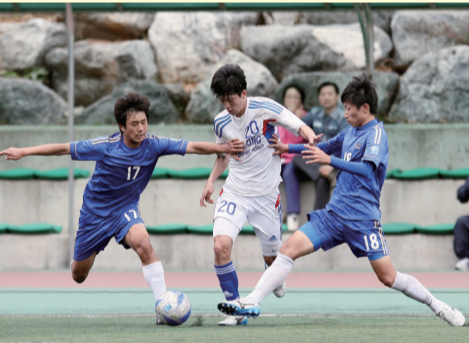
두 명이 가로막아도 도망갈 틈은 있다! (대동세무고 vs. 청운고) / 하서영 기자