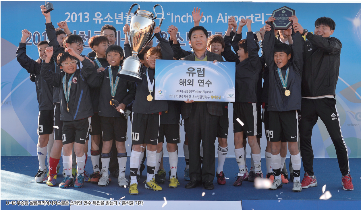
U-12 우승팀 살롬코리아사커스쿨은 스페인 연수 특전을 받는다

‘2013 유·청소년 클럽축구 Incheon Airport리그’에서 경기 내용, 전력, 전술 분석은 그리 중요한 게 아니다. 모두가 최선을 다하는 것과 결과에 승복하고 승자를 축하하는 모습이 적어도 이 대회에서는 더 가치 있는 일이다.