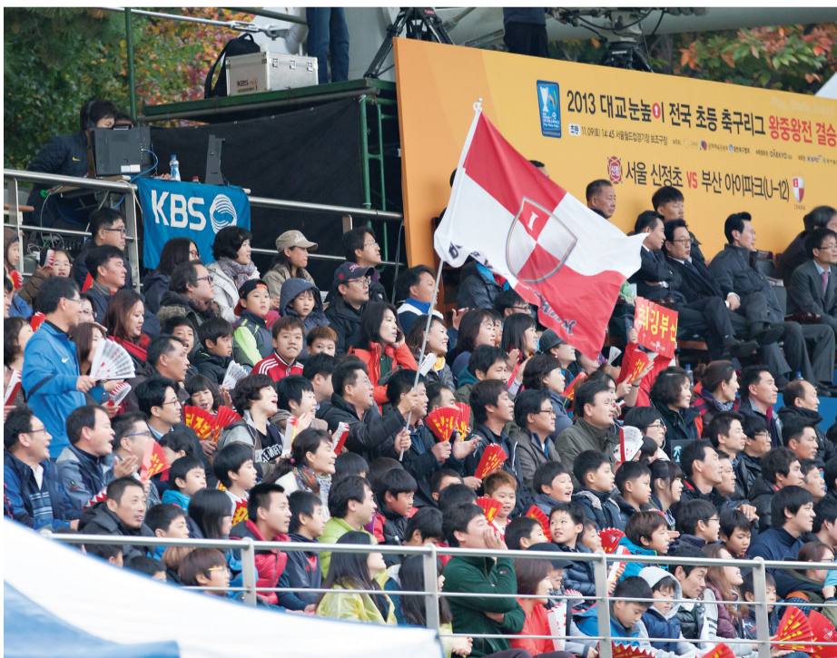
부산 U-12팀 이겨라~ 관중석을 가득 메운 부산 U-12팀 응원단 (부산 U-12팀 vs. 신정초)