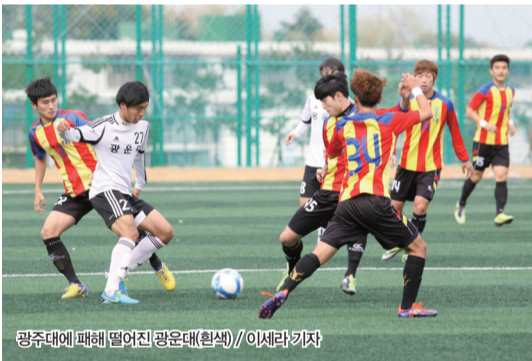
광주대에 패배 떨어진 광운대(흰색) // 이세라 기자

강호들의 탈락... 이번의 챔피언십 명백한 우승 후보가 모두 탈락했다. 디펜딩 챔피언 연세대를 비롯해 권역리그 1위를 차지한 상지대와 전통 강호 광운대 등이 모두 탈락했다. 강력한 우승 후보였던 디펜딩 챔피언 연세대는 건국대와의 경기에서 0-1로 패했다. 이미 조별리그 첫 경기에서 한남대에 패했던 연세대는 2패로 탈락이 확정됐