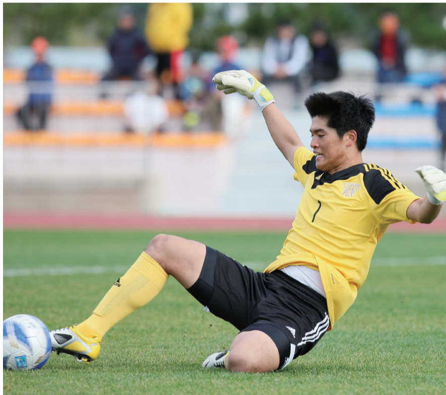
급하면 발이라도 뺏어야죠~ (동래고 vs. 포항 U-18팀)