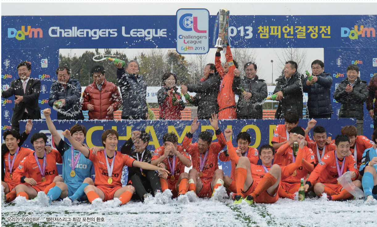
우리가 우승이데!... 챌린저스리그 최강 포천의 환호

‘챔결 직행’ 포천, 가파른 상승세의 파주 가볍게 꺾어 안성남-강석구-심영성-서동현 릴레이골... ‘적수가 없다’ 2009-2012-2013 ★ 새겼다. 대회 단독 최다 우승 차지