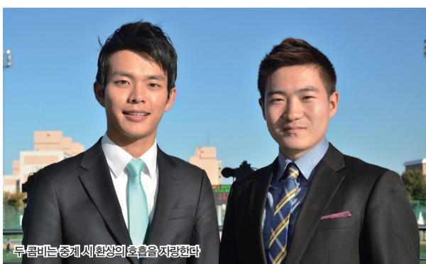
두 콤비는 중계 시 환상의 호흡을 자랑한다

“저는 시청하는 분들이 계속 의자에 앉아있을 수 있는 ‘매력 있는 중계’를 최우선으로 생각해요. 저희가 중계한 U리그, 챌린저스리그, WK리그가 모두 다른 매력이 있듯이 타 중계와는 다른 색다름으로 찾아뵙겠습니다.” 양동석 캐스터 / 글 김동현 기자