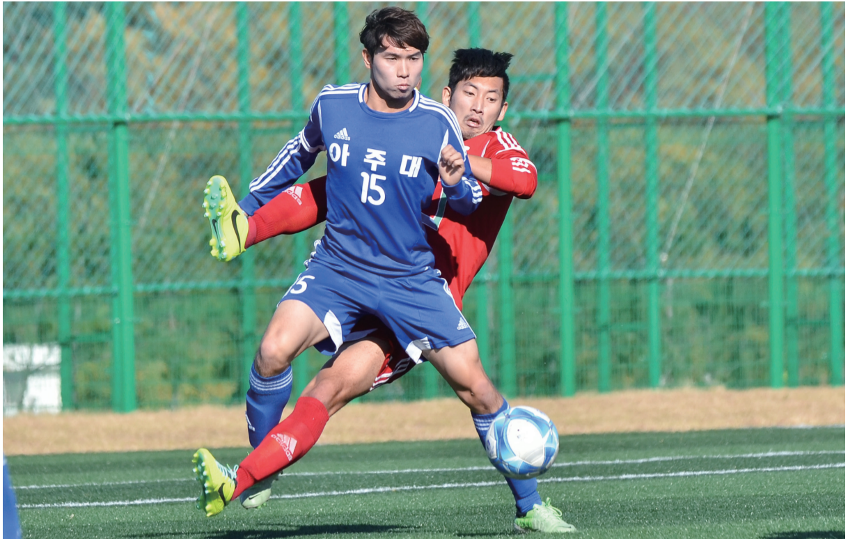
어머나! 다리가 꼬인 채 넘어져도 시선은 공에 고정 (아주대 vs. 경기대)