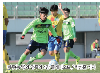
파주(녹색)와 경주의 4강 플레이오프

프리킥 한 방이 승부를 갈랐다. 파주가 홈에서 경주를 1-0으로 꺾고 준결승 플레이오프에 진출했다. 두터운 미드필드진의 빌드업으로 볼 점유율에서 앞서나간 파주는 수비를 두텁게 구축한 경주를 상대로 맹공을 펼쳤다. 그리고 전반 42분 아크 왼쪽 부근에서 얻은 프리킥을 조재석이 골대 먼 쪽으로 향해 직접 슈팅으로 득점에 성공했다.