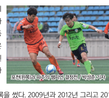
포천(왼쪽)과 파주의 챔피언 결정전

하지만 파주의 거침없는 상승세는 포천이라는 산을 넘지 못했다. 포천종합운동장에서 열린 챔피언 결정전에서 파주는 0-4로 무너졌다. 포천의 안성남, 강석구, 심영성, 서동현이 연속골을 터뜨렸다. 한 달 이상 실전이 없었던 포천은 노련미로 파주를 완벽히 제압했고 체력적인 문제가 겹친 파주는 이렇다 할 플레이를 펼치지 못하면서 아쉽게 돌아섰다.