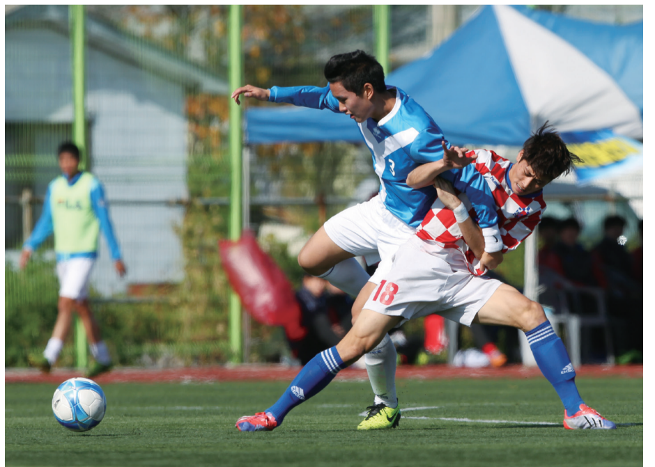
축구장에서 엮어치기? 이건 유도가 아니라고~ (연세대 vs. 한남대)