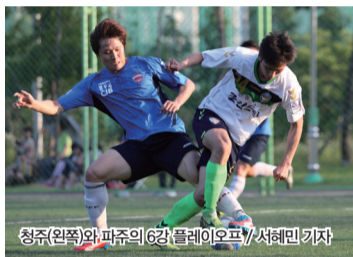
청주(왼쪽)와 파주의 6강 플레이오프

원정팀이 나란히 승리했다. 경주는 이천 원정에서 짜릿한 승리를 거뒀다. 경주는 전반 37분 이호세, 후반 12분 정세환의 연속골로 리드를 잡았다. 하지만 이천은 후반 17분 정준영, 후반 32분 이진용의 골로 균형을 맞췄다. 연장전에서 승부를 가리지 못한 두 팀은 승부차기에 돌입했고 결국 5-4로 경주가 웃었다.