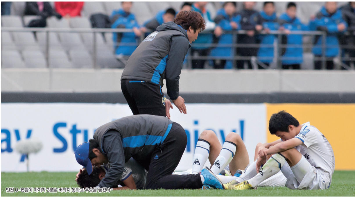
인천 U-15팀이 마지막 2분을 버티지 못하고 우승을 놓쳤다

‘최강의 팀’ 울산 U-15팀 맞아 분전... 종료 2분 앞두고 극적인 동점골 허용 우성용 감독 “마지막에 못 버틴 것 안타까워... 그래도 명승부 펼쳐준 선수들 대견”