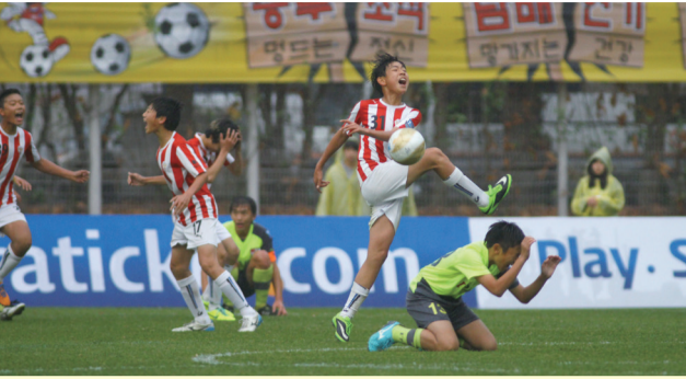
환희와 눈물이 교차하는 순간 (부산 U-12팀 vs. 신정초)