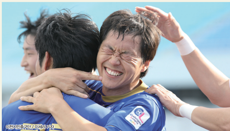
이천시민축구단 / 이세라 기자

번이 처음이 아니다. 2009년과 2011년에도 페어플레이팀상을 수상한 바 있다. 구단 측 역시 선수들에게 좋은 공격력과 함께 항상 '페어플레이'를 강조한다.