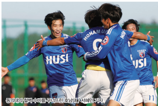
동의대의 철벽 수비를 무너뜨린 호남대

영남대는 후반 8분 정대교의 득점을 시작으로 최광수와 정원진이 연이어 득점을 터뜨리며 3-0 완승으로 4강행에 합류했다. 가장 늦게 4강행 열차에 탑승한 팀은 동아대였다. 이주용, 홍현진의 연속골로 송실대를 꺾고 팀의 창단 첫 4강 진출을 확정 지었다.