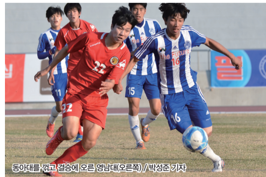
동아대를 꺾고 결승에 오른 영남대(오른쪽)