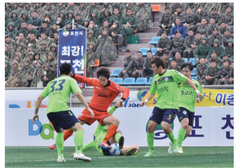
군인으로 딱 찬 관중석, 포천이 최강이 된 이유 (포천 시민축구단 vs. 파주시민축구단)