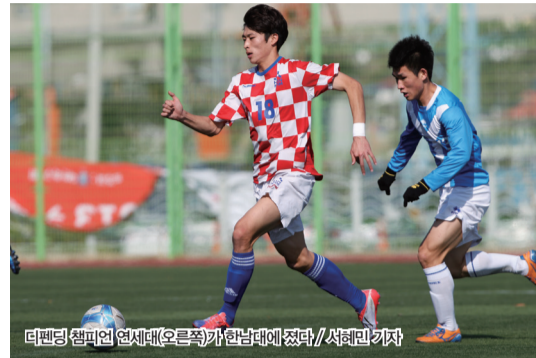
디펜딩 챔피언 연세대(오른쪽)가 한남대에 졌다