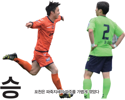
포천은 파주지세의 파주를 가볍게 꺾었다

‘챔결 직행’ 포천, 가파른 상승세의 파주 가볍게 꺾어 안성남-강석구-심영성-서동현 릴레이골... ‘적수가 없다’ 2009-2012-2013 ★ 새겼다. 대회 단독 최다 우승 차지