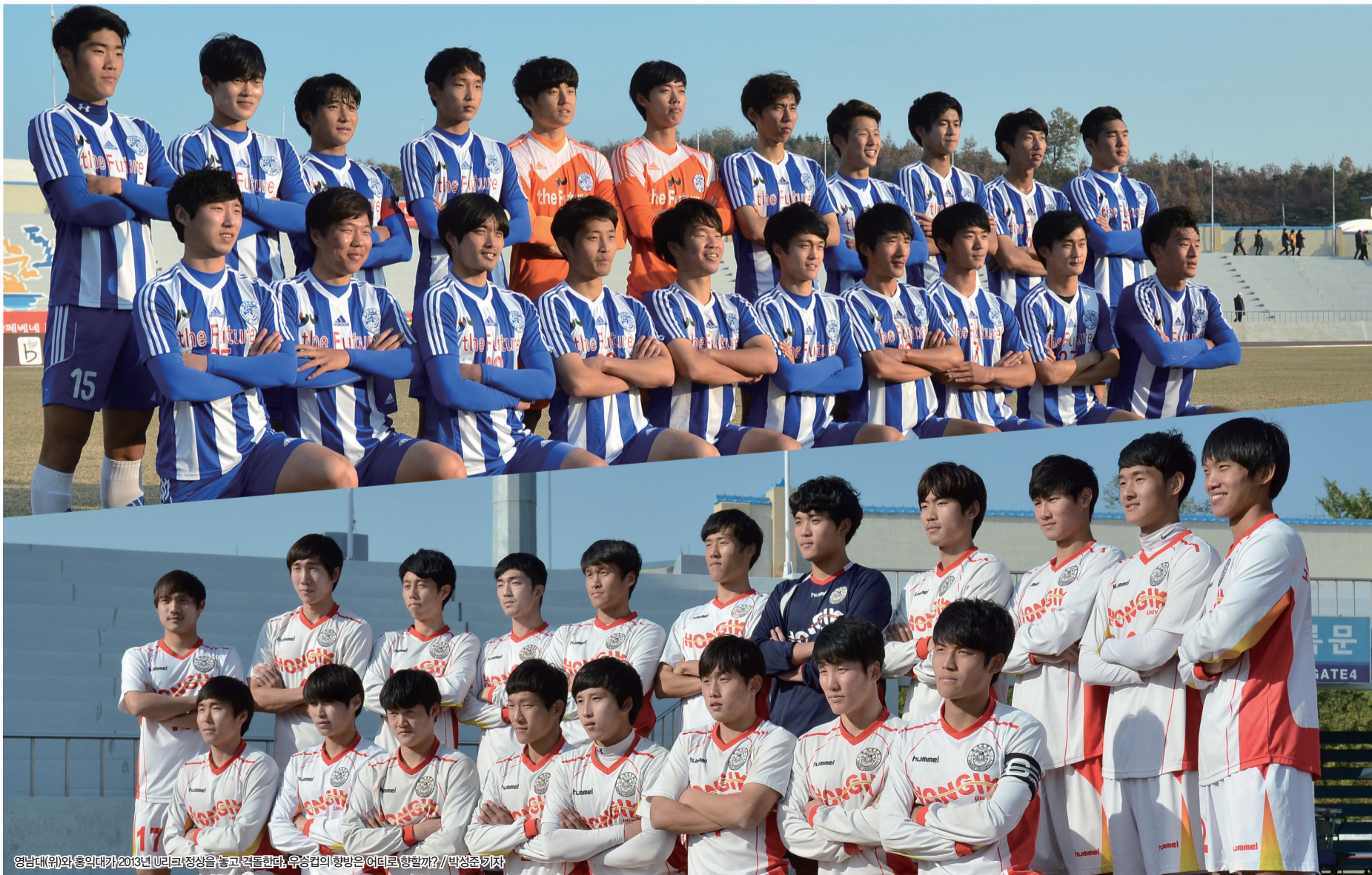
영남대(위)와 홍익대가 2013년 U리그 정상을 놓고 격돌한다. 우승컵의 향방은 어디로 향할까?